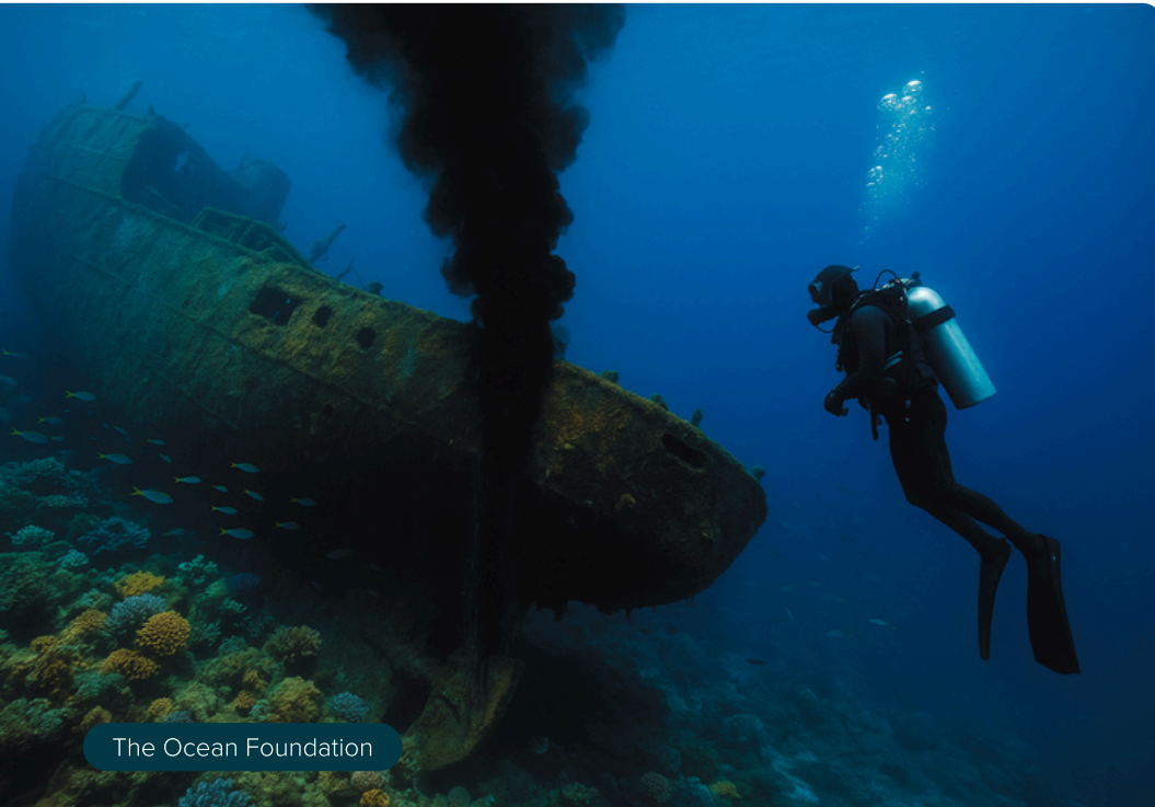
The Ocean Foundation

Qu'ils soient issus des "Rencontres Pour la Planète" ou des coups de cœur des fondateurs, Domorrow soutient des projets qui ont en commun d'avoir su les interpeller par la sincérité de leur démarche et la puissance émotionnelle de leur récit. Cette vision s'est concrétisée en 2025 par le soutien de 10 nouveaux projets.